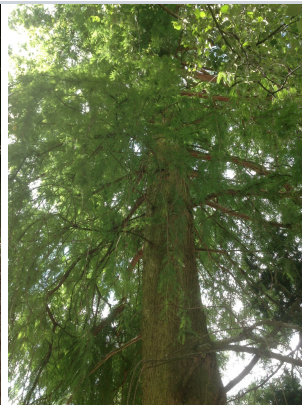
, 02 Septembre 2013