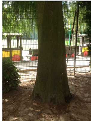
, 02 Septembre 2013

XLSX (Excel 2007) - XLS (Excel 1997-2003) .