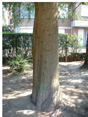
, 04 Août 2003