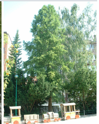
, 04 Août 2003